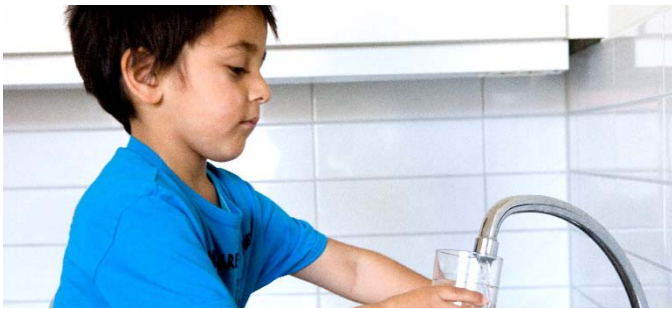
آب بهترین نوشیدنی است. آب لوله کشی قابل آشامیدن است.