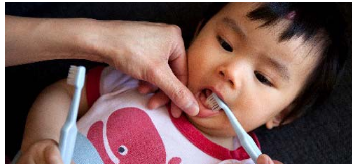
به فرزند خود کمک کنید صبح و شب دندانهای خود را با خمیر دندان دارای ماده فلئور مسواک بزنند.