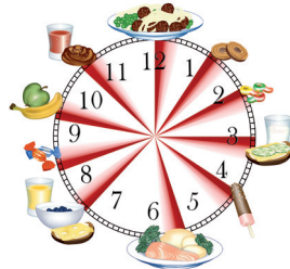
Äta ofta – stor risk för karies