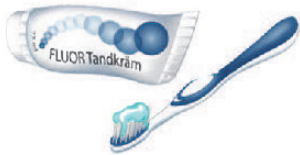
Tandborstning med fluor- tandkräm stärker tänderna