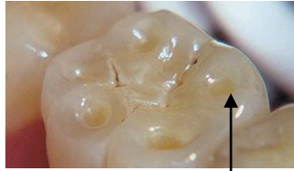
ጎዳጉድ አብ ጸፍሒ ስኒ |