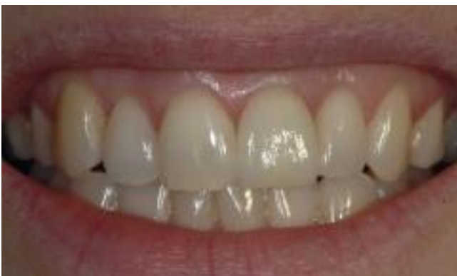
The new crown is now in place.