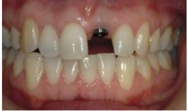
البرغي المزروع جاهز لتثبيت تاج السن الجديد.

إما أن يتم فتل السن إلى البرغي أو أن يتم تثبيته بالملاط (إسمنت).